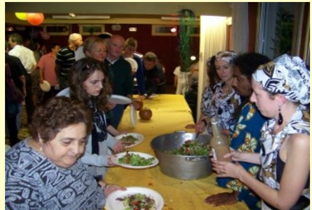
Découverte des saveurs africaines...