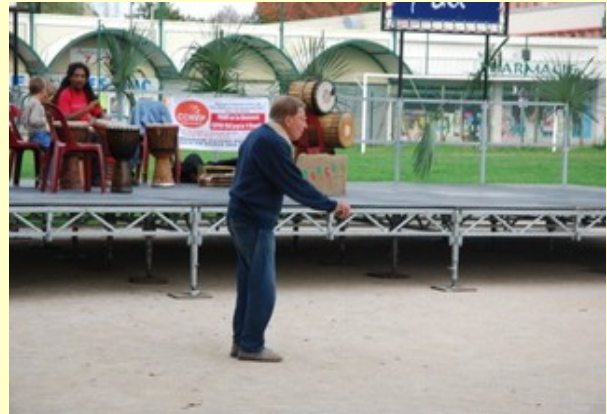
Des habitants nullement perturbés dans leurs habitudes...