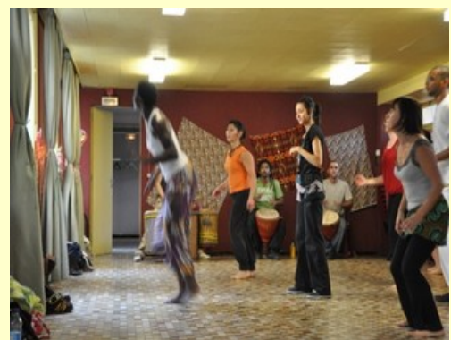
La Pépinière a tremblé sous les rythmes africains !