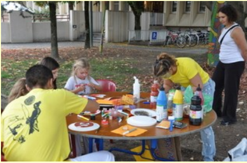
Création de masques