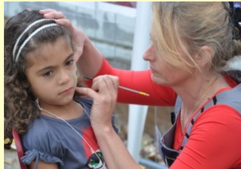
On va en avoir plein les yeux !