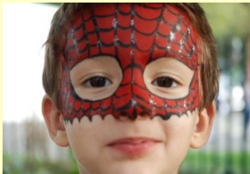
Nos super héros !