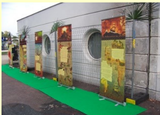
Le festival était l'occasion d'inaugurer la nouvelle version de notre exposition sur la Capoeira