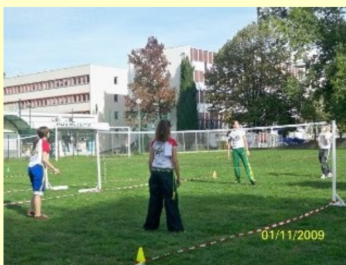
La Pétéca: un jeu sportif 100% d'origine traditionnelle

« Moi, j'ai bu du Guarana, j'ai regardé de la Capoeira, puis on a joué au jeu de la Dame.