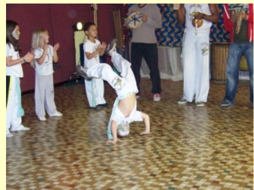
Un spectacle renversant...!