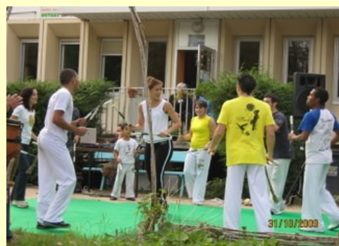
La Pépinière et le P'tit Caf' aux premières loges