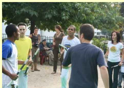
Le Club Photo à l'affût !