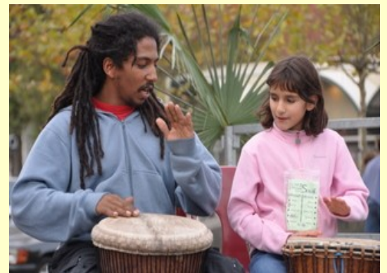
Passeport vers la percussion