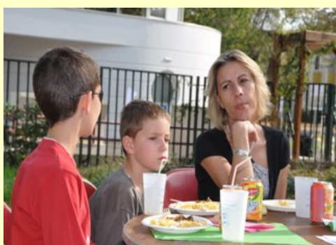
Un moment de détente pour notre partenaire La librairie « Le BCBG »