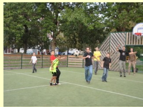
Une équipe de foot « Festival » s'était constituée pour se mesurer aux jeunes du quartier...