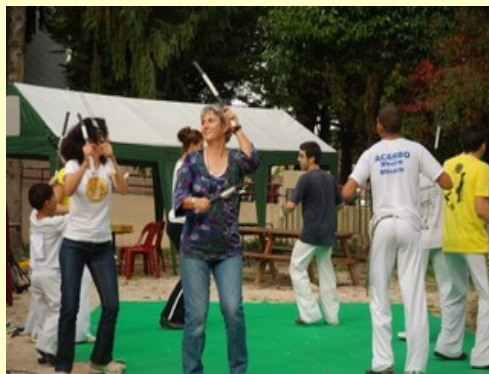
Notre trésorière n'a pas que les chiffres en tête