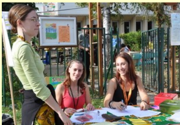
Je crois qu'on a un ticket...