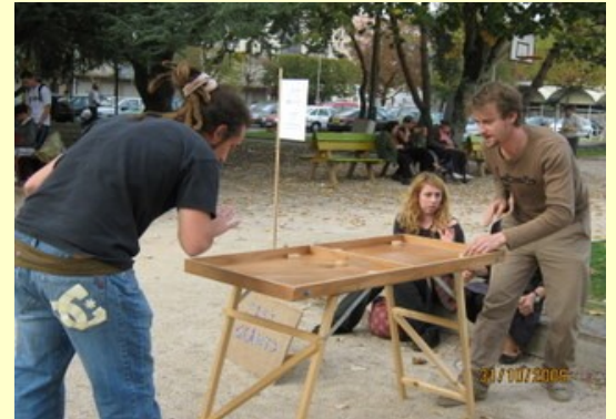
Nos graphistes aussi aiment jouer