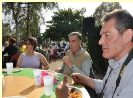
Le Club Photo de la Pépinière se restaure...