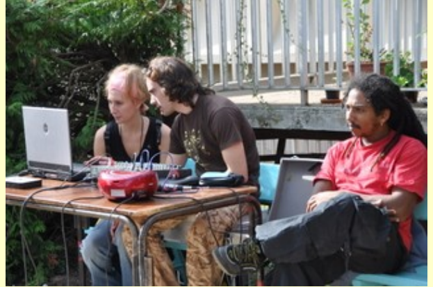
Attention, c'est technique là !

« Du soleil ! Des sourires ! Des couleurs ! De bons petits plats ! Et du son plein les oreilles !!... Que du bonheur ! »