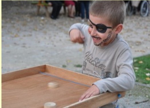
On dirait bien qu'il s'éclate