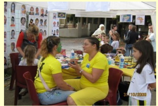
Isa...belle aux couleurs du Brésil