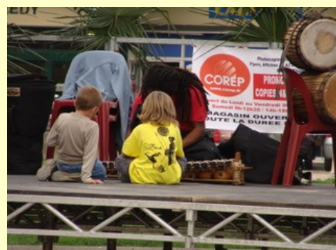
Des « mondes » qui se rencontrent