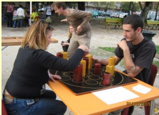
Un instant de silence svp, il y a de la concentration là !

« C'est ma 3ème édition et je reviens à chaque fois avec plaisir.