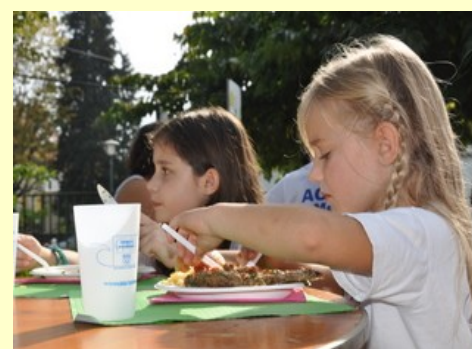
Les enfants s'initient au verre à consigne