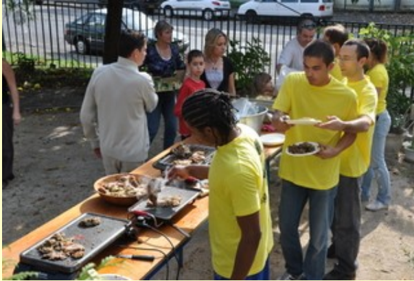
Organisation et solidarité